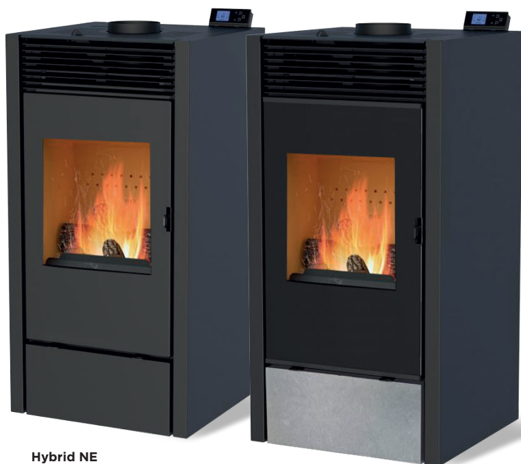
Hybrid NE Sort antracit